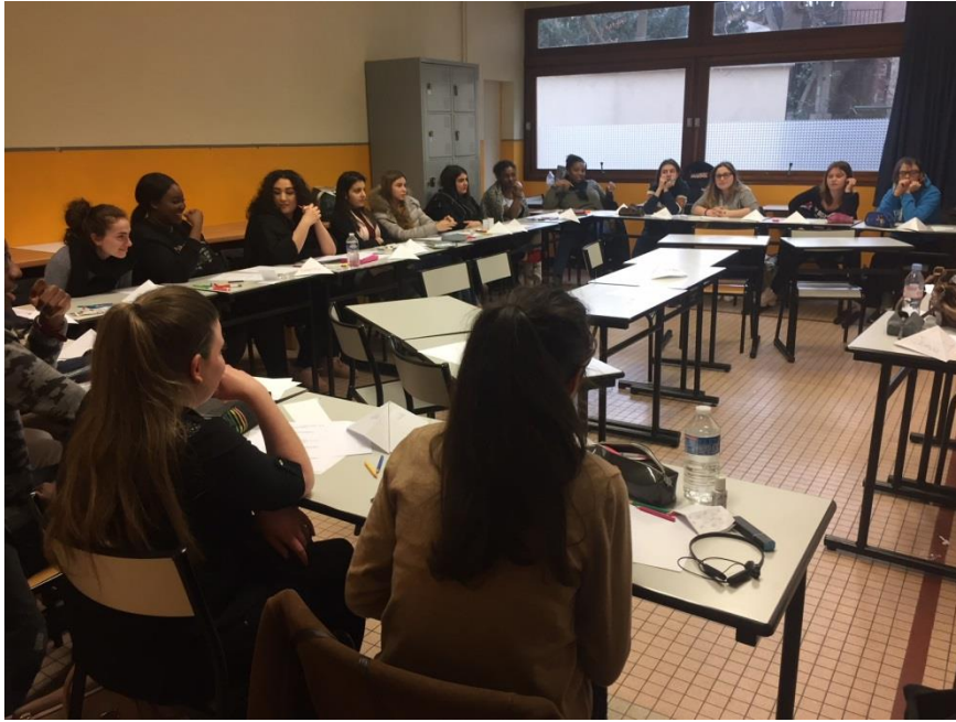
Atelier de carte heuristique