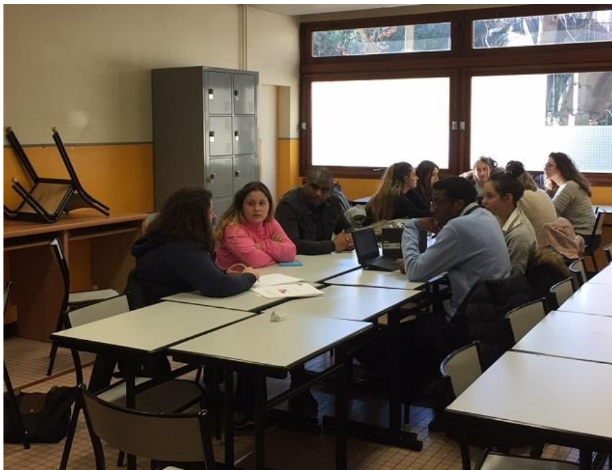
Tutorat avec des étudiantes en BTS ESF de l'établissement Clorivière