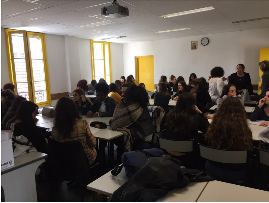
Tutorat avec l'établissement Saint Jean de Montmartre